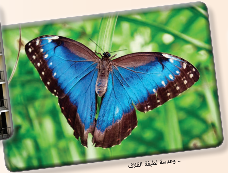
.. وعدسة لطيفة القلاف