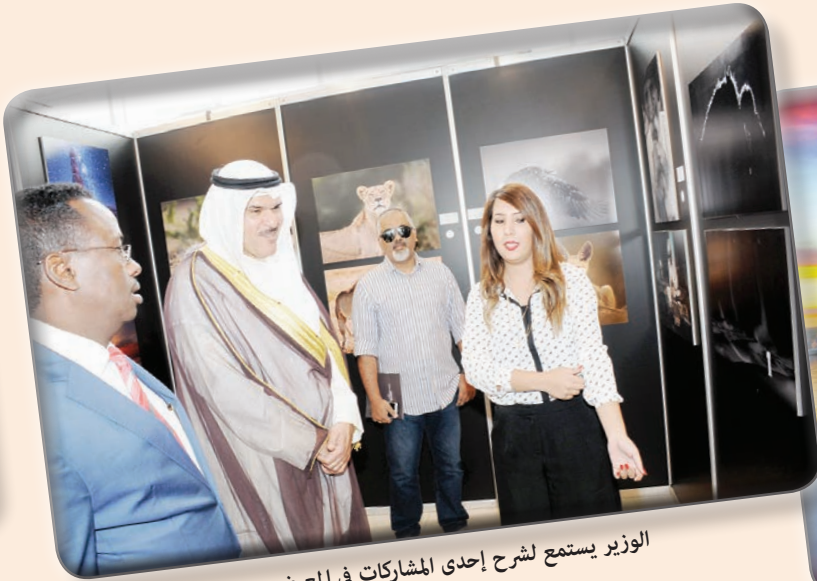
الوزير يستمع لشرح إحدى المشاركات في المعرض