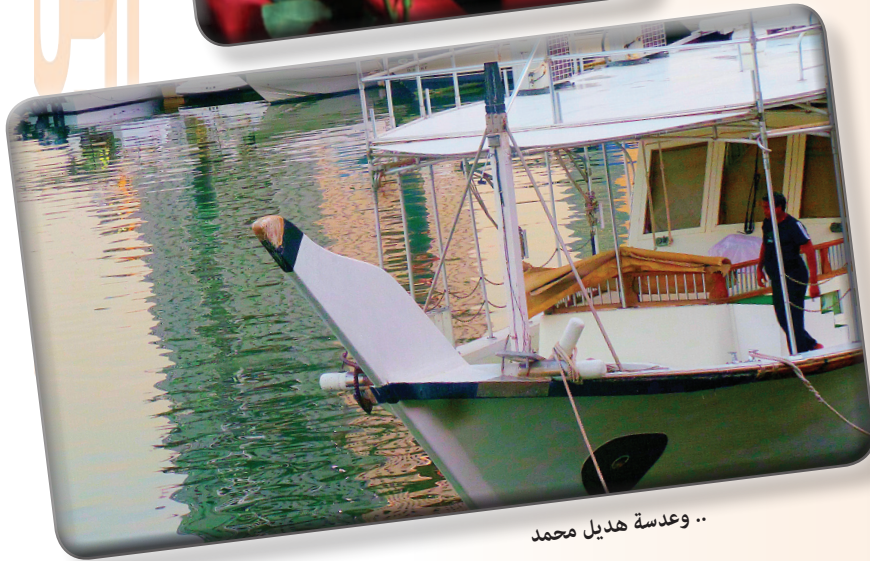
.. وعدسة هدىل محمد

امتاعا فنيا للقارئ وتشير إلى وجود جيل فني كويتي يجيد لغة التعامل مع العدسة، ومع كل هذا الإبداع نرى خزينا فوتوغرافيا جميلا يقدم لغة الصورة بروعتها ويقدم أيضا المتعة البصرية لجموع متذوقي ومتابعي حركة التصوير الفوتوغرافي في الكويت.