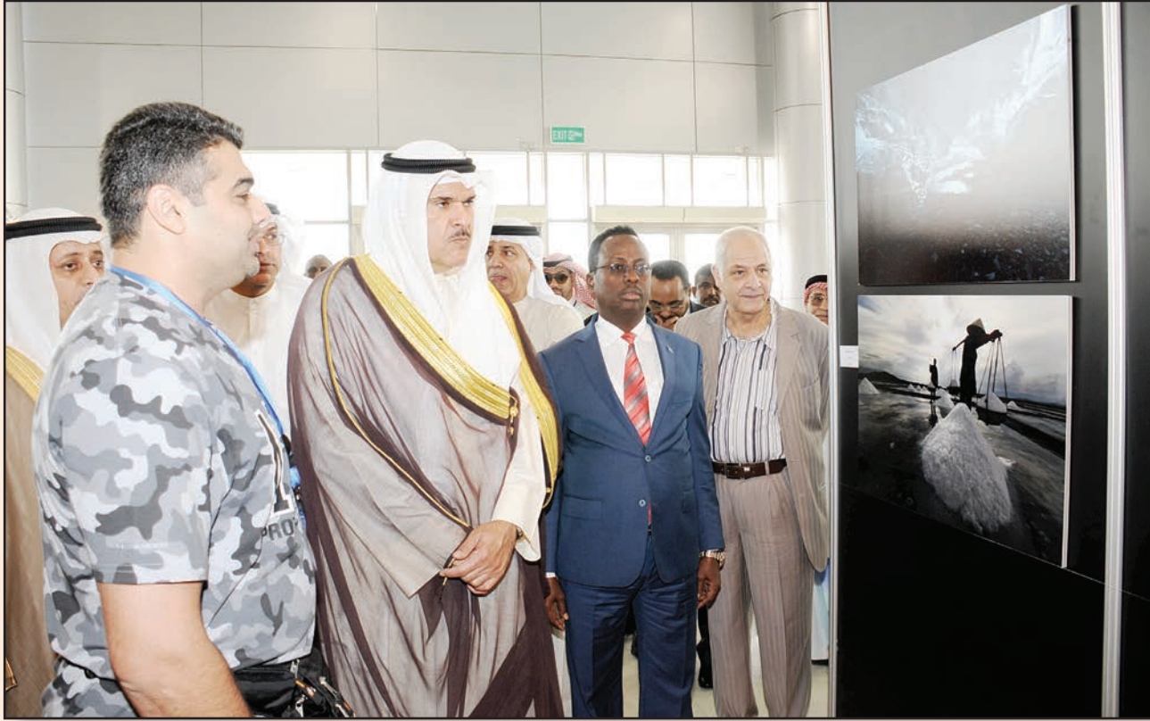
الوزير الحمود خلال جولته في معرض التصوير الفوتوغرافي