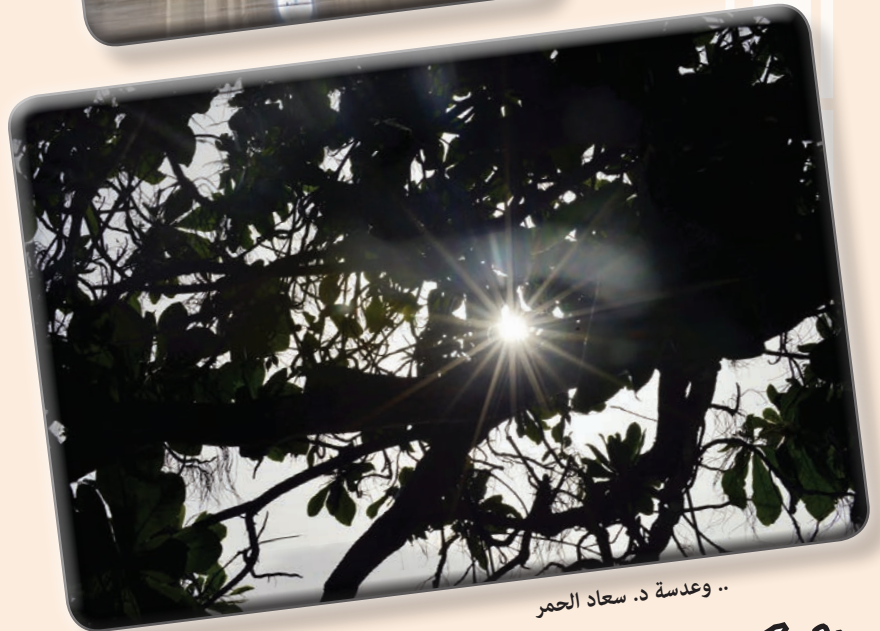
.. وعدسة د. سعاد الحمر