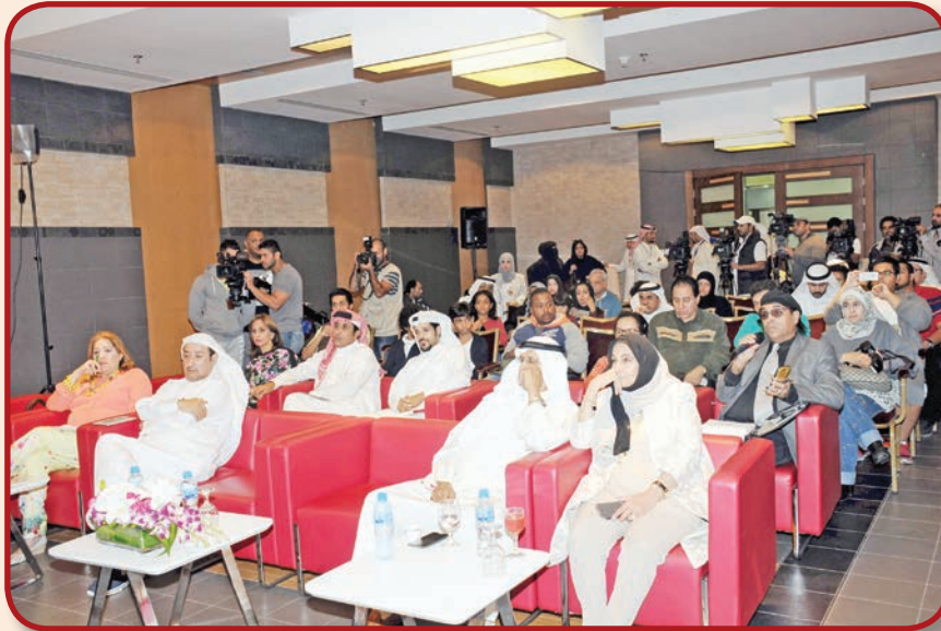
حضور المقي الثقافي

وقالت الاديبه ليلي العثمان: لا أحب الدراما الكويتية، كلها مط وتطويل ومكياج «أوفر» وصراخ وطق وسباب، وأحيانا أشعر بأن المسلسل مصري وتم تكويته، وأنا شخصيا لا أتابع سوى حياة الفهد.