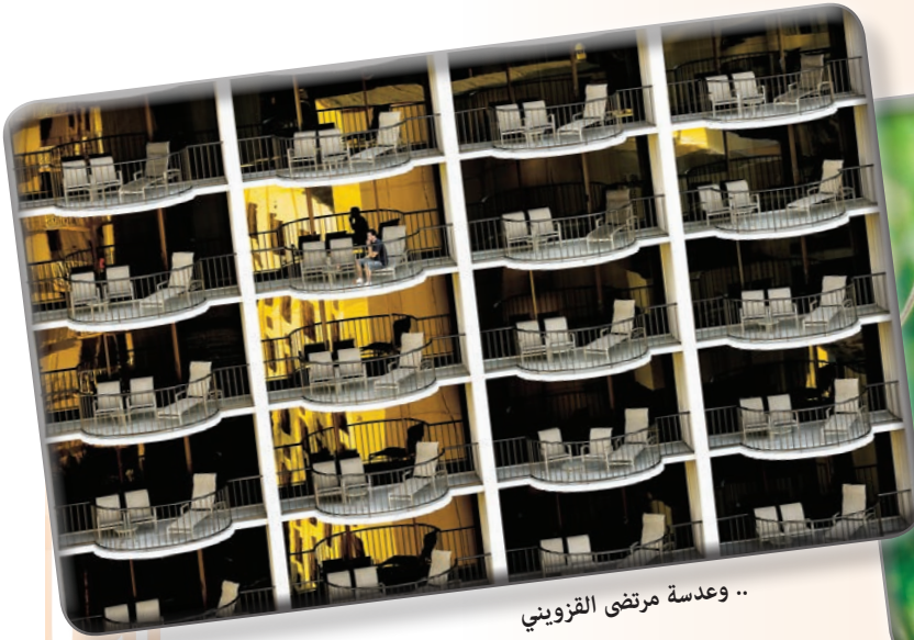
.. وعدسة مرئى القزوينى