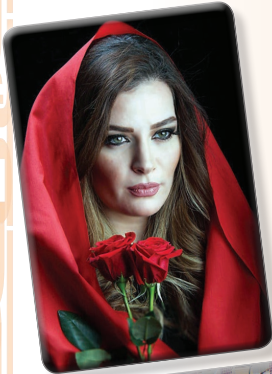
.. وعدسة ريم البنا